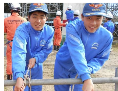
【山武郡市広域行政組合東消防署】