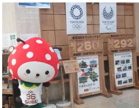
【山武市役所 サマーカーニバル実行委員会】