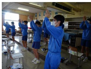
2年音楽（リズム打ち）