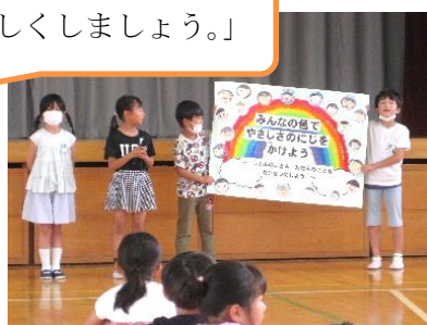
【2年生のスローガン】