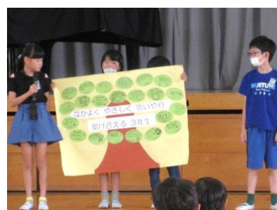
【3年生のスローガン】