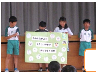
【4年生のスローガン】