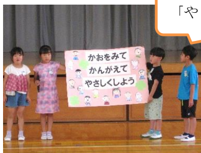
【1年生のスローガン】

7月4日(火)に、運営委員会主催のいじめをなくそう集会を実施しました。学級毎にいじめ撲滅にむけたスローガンを発表し合い、117名の児童が 4つの勇氣(やめる勇氣・とめる勇氣・はなす勇氣・みとめる勇氣) をもち、みんなの笑顔を大切にしながら生活することを誓い合いました。