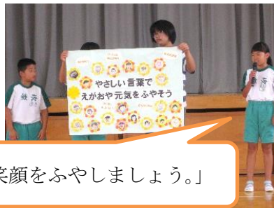
【5年生のスローガン】