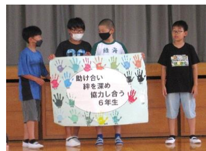
【6年生のスローガン】