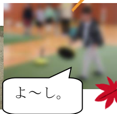
【グラウンドゴルフ・ユニカール】