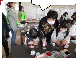
【おしぼりワンちゃん】