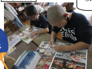
【縄文アクセサリー】