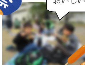
【秋空の下、芝生で昼食】