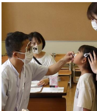
耳鼻科健診の様子