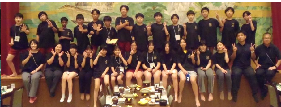
天成園の夕食前にステージで記念撮影