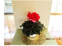
玄関のシクラメン

南郷小の中央玄関に、シクラメンの花が飾られました。今年では温かな秋晴れが続き、紅葉もゆっくりで、イチヨウの葉もまだ鮮やかな黄色の装いです。秋晴れの校庭では、まだ半そで姿の児童も…。シクラメンの花は、そんな学び舎に、冬の訪れを伝えてくれています。