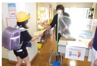
【昇降口で健康チェック】

☆ 5月11日の登校日の様子です。どのクラスでも、隣の席を離しています。でも、久しぶりの教室。嬉しそうでした。