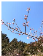
(体育館前の河津桜)